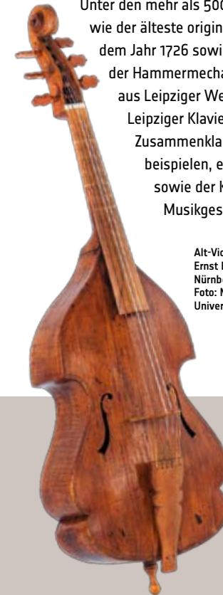
Alt-Viola da gamba, Ernst Busch, Nürnberg, um 1640

Unter den mehr als 5000 Instrumenten finden sich Kostbarkeiten wie der älteste original erhaltene Hammerflügel der Welt aus dem Jahr 1726 sowie fünf weitere Instrumente des Erfinders der Hammermechanik Bartolomeo Cristofori, Meisterwerke aus Leipziger Werkstätten der Bachzeit, Zeugnisse des frühen Leipziger Klavierbaus, Musikautomaten und vieles mehr. Im Zusammenklang mit grafischen Darstellungen, 3D-Musikbeispielen, einer Hologramm-Installation, dem Klanglabor sowie der Kinoorgel im großen Vortragssaal lassen sie Musikgeschichte für alle Sinne lebendig werden.