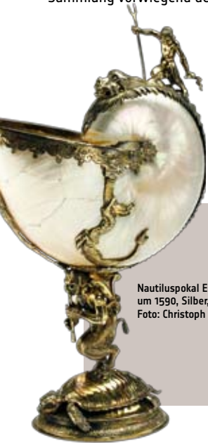
Nautiluspokal Enkhuizen (Niederlande), um 1590, Silber, Nautilusmuschel

Als zweites Kunstgewerbemuseum Deutschlands im Jahr 1874 eröffnet, zählt das heutige Museum für Angewandte Kunst zu den traditionsreichsten Einrichtungen seiner Art in Europa. Die Sammlungen umfassen kunsthandwerkliche Unikate aller Epochen wie auch seriell gefertigte Industrieprodukte. Jugendstil, Art déco und Funktionalismus bilden profilbestimmende Sammlungsbereiche in nahezu allen Sparten. Mit einer umfangreichen Kollektion zur DDR-Produktgestaltung konnte der Bereich des Industriedesigns weiter ausgebaut werden. Zu einem neuen Schwerpunkt hat sich die Sammlung vorwiegend deutscher Keramik des 20. Jahrhunderts entwickelt.