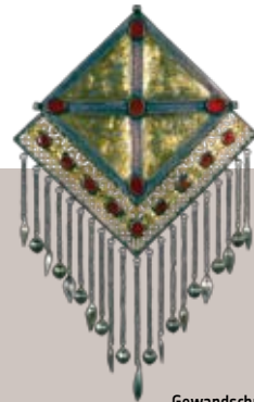
Gewandschmuck der Frauen, Turkmenistan, Silber, 1. Hälfte des 19. Jahrhunderts