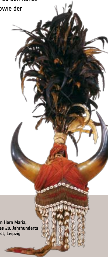
Kopfaufsatz der Bison Horn Maria, Indien, 20er Jahre des 20. Jahrhunderts

Um den Einblick in die Staatlichen Ethnographischen Sammlungen Sachsens zu erweitern, ist auch eine Reise nach Dresden und Herrnhut empfehlenswert. In den Völkerkundemuseen dort werden andere, ebenso faszinierende Einblicke vermittelt.