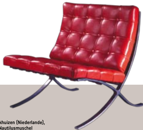
Barcelona-Sessel, Stahl, Leder Entwurf: Ludwig Mies van der Rohe, 1929 Berlin, 1930er Jahre