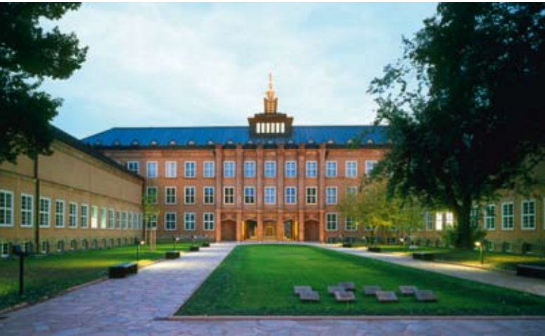
Grassimuseum, Foto: Gunter Binsack, Leipzig

Als der Leipziger Kaufmann und Mäzen Franz Dominic Grassi (1801 – 1880) starb, hinterließ er der Stadt Leipzig ein beträchtliches Vermögen. Es floss