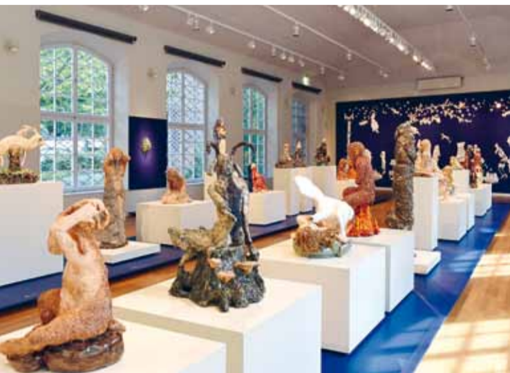
Blick in die Sonderausstellung CAROLEIN SMIT