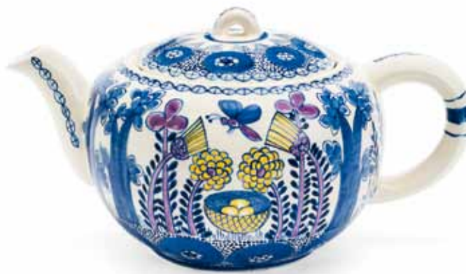
Teekanne mit sogenanntem Dekor »Paradiesgarten« Dekor nach Charlotte Hartmann, um 1922 Entwurf der Form: Hedwig Bollhagen, 1934 Ausführung: HB-Werkstätten für Keramik Marwitz, um 1936/37 Zu sehen in der Sonderausstellung BLUMEN FLOWERS FLEURS

FÜHRUNGEN Öffentliche Führungen sind kostenfrei. Es ist lediglich der Eintritt in die Ausstellung zu zahlen. Sonderführungen auf Deutsch, Englisch, Französisch und Russisch sind nach Voranmeldung unter www.grassimuseum.de/service Anfragen unter Tel.: 0341 / 22 29 242