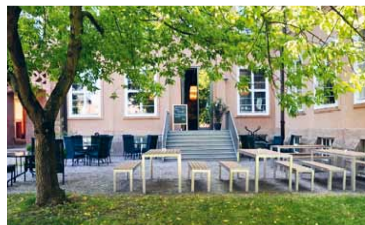
Für die Kunstpause zwischendurch: das Café im GRASSI mit Terrasse

CHINESISCH ODER DÄNISCH? Chinesische Glasuren in der dänischen Keramik. Durch die Sonderausstellung MADE IN DENMARK; mit Silvia Gaetti