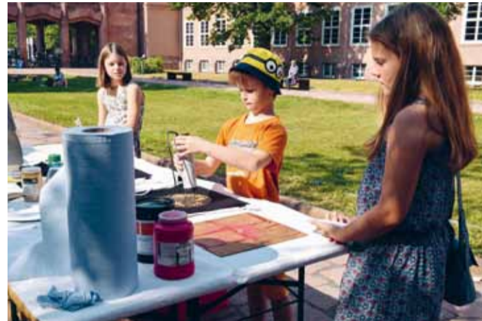
Kreativangebote laden beim GRASSI-FEST zum Ausprobieren ein.

Nähere Informationen unter: www.sommertheater-leipzig.com