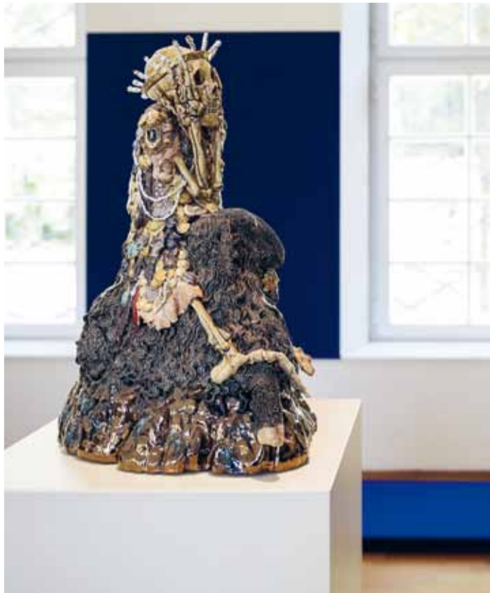
»Skelett auf einem schwarzen Schaf« in der Sonderausstellung CAROLEIN SMIT