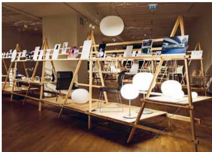
Blick in die Ausstellung »JASPER MORRISON. Thingness«