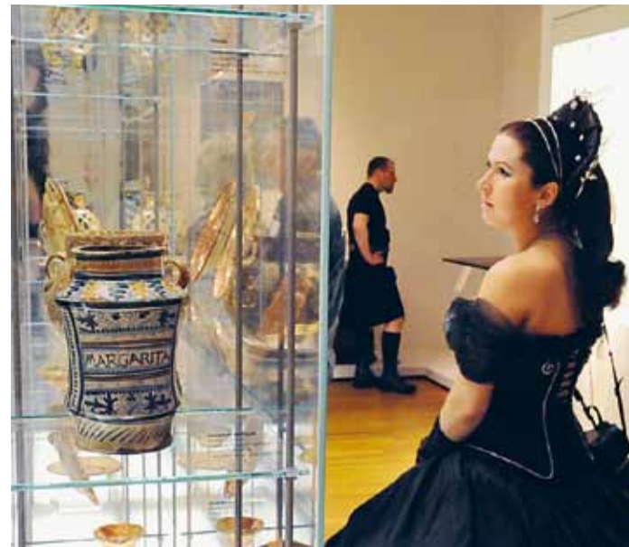
Besucher des Wave Gotik Treffens in der Dauerausstellung

FÜHRUNGEN Sonderführungen auf Deutsch, Englisch, Französisch und Russisch sind nach Voranmeldung unter grassimuseum@leipzig.de oder Tel.: 0341 / 22 29 101 möglich.