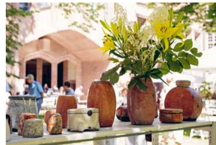
KERAMIKMARKT LEIPZIG IM GRASSI

Begleitend findet ein Wettbewerb unter dem Motto »In Hülle und Fülle« statt, drei Preise werden vergeben. Die Preisträgerstücke sowie sämtliche Einreichungen der Keramiker*innen werden während des Keramikmarktes in der Art déco-Pfeilerhalle präsentiert. www.keramikmarkt.terra-rossa-leipzig.de