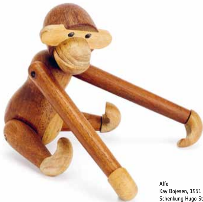
Affe Kay Bojesen, 1951 Schenkung Hugo Ströh, Kiel, 2016