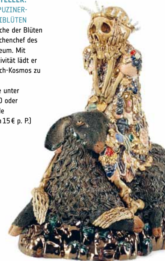
Carolein Smit Skelett auf einem schwarzen Schaf, 2012

BLUMIGES UND KULINARISCHES FRISCH AUF DEN TELLER: LÖWENZAHN – KAPUZINERKRESSE – ZUCCHINIBLÜTEN Ein Exkurs in die Küche der Blüten mit Heiko Arndt, Küchenchef des Cafés im Grassimuseum. Mit Erfahrung und Kreativität lädt er ein, den eigenen Koch-Kosmos zu erweitern. ☛ Anmeldung bitte unter Tel.: 0341 / 22 29 330 oder info@cafeimgrassi.de bis zum 9.6. (Kosten 15 € p. P.)