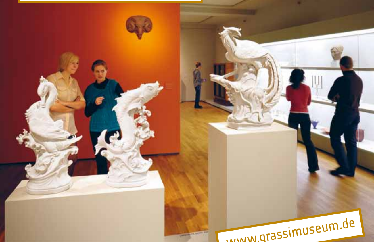
Besucher in der Dauerausstellung

3.12., 10:00—18:00 UHR Zehn Jahre neu: 2007—2017