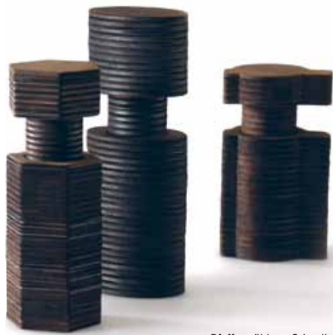
Pfeffermühlen »Schnelle Kohle« Isabelle Enders, 2017 Pappelsperholz, Keramikmahlwerk, lasergeschnitten, verleimt, angekohlt