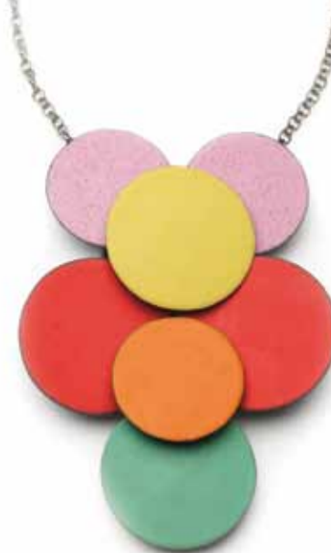
Ausstellung »Blumen Flowers Fleurs«: Halsschmuck, Daniel Kruger, Halle/Saale, 2008, Email auf Kupfer, Silber

Sa, 18.11. / 10:00 Uhr WORKSHOP MIT BLUMEN DURCH DAS JAHR 2018 Siehe Workshop am 17.11.