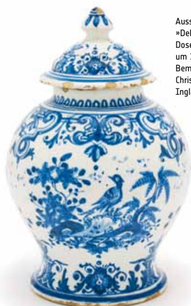
Ausstellung »Delft Porcelain«: Dose, Rudolstadt um 1745/1750, Bemalung: Heinrich Christoph Caspar Fries, Inglasurbemalung

Do, 05.10. / 14:00 Uhr NICHT NUR FÜR ÄLTERE SEMESTER VERSCHWENDERISCH SCHÖN. LUXUSBRANCHEN IN JUGENDSTIL UND ART DÉCO Nach dem Besuch der Ständigen Ausstellung JUGENDSTIL BIS GEGENWART werden parfümierte Seifen »luxusgerecht« hergestellt. Mit Axel Menz (8 €)