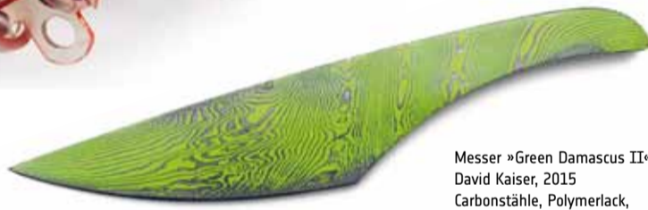
Messer »Green Damascus II« David Kaiser, 2015 Carbonstähle, Polymerlack, tordierter Damaszenerstahl, beschichtet