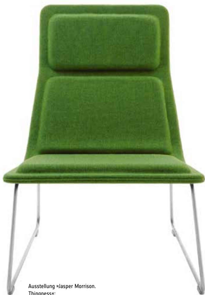
Ausstellung »Jasper Morrison. Thingness«: Low Pad Sessel. Entwurf: Jasper Morrison, Hersteller: Cappellini, 1999